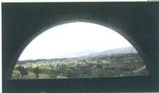
Vista de la Poble de Cérvoles des de dins del celler.

L'artista Josep Guinovart va ser un entusiasta del projecte d'aquest celler i va participar activament en la seva decoració. Més endavant, el celler oferirà activitats per degustar els seus productes i conèixer l'obra de Guinovart.