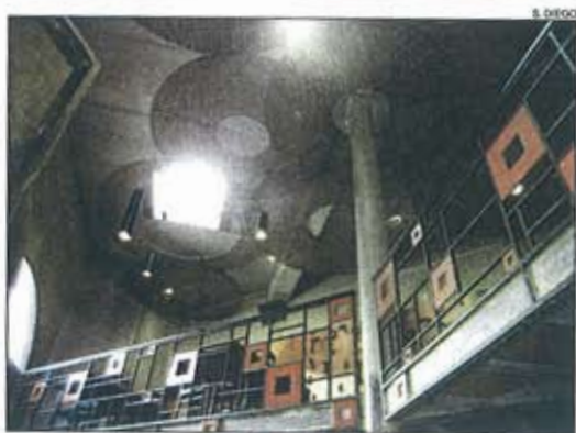
El disseny del sostre del celler deixa passar la llum natural.

cialització del vi. La idea va sorgir quan després de molts anys produint-ne per al consum propi els en va sortir un d'una "excel·lentíssima qualitat", molt ben valorat pels enòlegs, i llavors es van decidir a tirar endavant un projecte empresarial que ha cul-